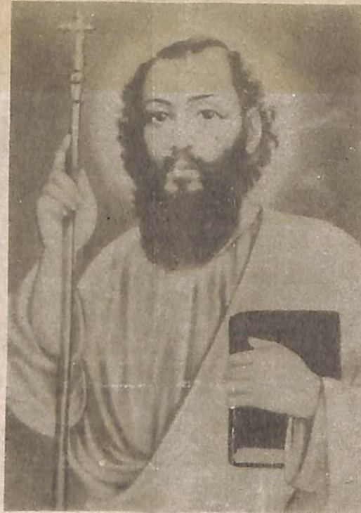
ST. THOMAS DAY JULY 3 rd Inserted by a Firm Believer U S A